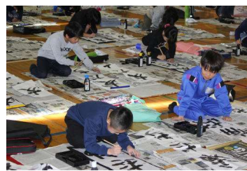
3年生 初めての書き初め大会

校内書き初め大会を3年生以上は体育館で行いました。子どもたちは真剣に取り組み、緊張感が満ちていました。また、1、2年生は、教室で硬筆に取り組みました。出来上がった作品は、1月15日~18日に各教室の廊下に展示します。子どもたちの力作を、ぜひご覧になってください。