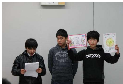
明治小児童の報告