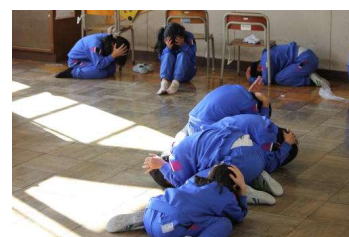
緊急地震速報（訓練放送）直後の様子